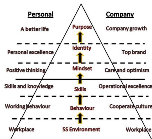
Gambar 2. Efek Domino Prinsip 5S (Sari, Rahmillah and Aji, 2017)

Metode 5S apabila diterapkan akan memiliki manfaat yang berkesinambungan, atau disebut efek domino yang digambarkan pada Gambar 2.